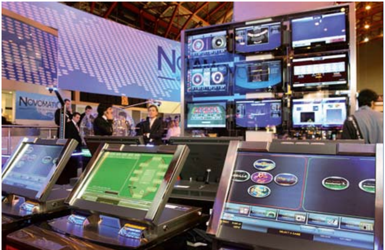
Última versión de NOVO LINE Novo Unity™ II en la ICE 2011.