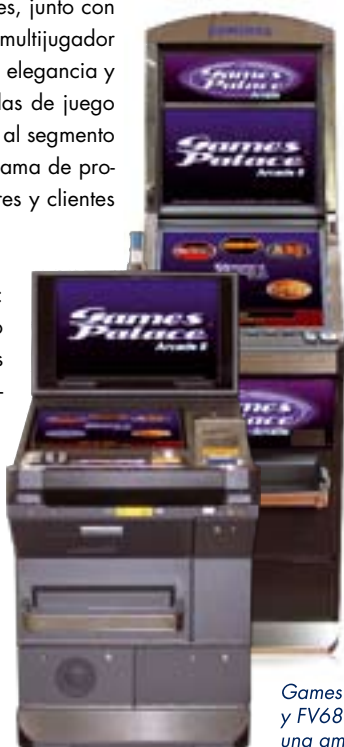
Games Palace Arcade II en los gabinetes FV762 y FV680: máquinas multi-juego de Astra que ofrecen una amplia selección de juegos.