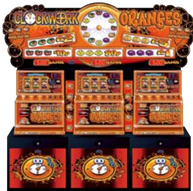
Clockwork Oranges de Empire Games.

Mientras tanto, Sonic – el personaje que echó a rodar la bolita Astra/Empire – está listo para el lanzamiento como un juego temático de gran atractivo. El personaje ‘Sonic’ tiene 20 años en el 2011 y es más que razonable sugerir que los próximos doce meses también traerán un motivo de celebración para la conglomeración ‘independientemente juntos’ de Astra Games y Empire. ■