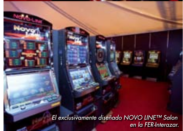
El exclusivamente diseñado NOVO LINE™ Salon en la FER-Interazar.