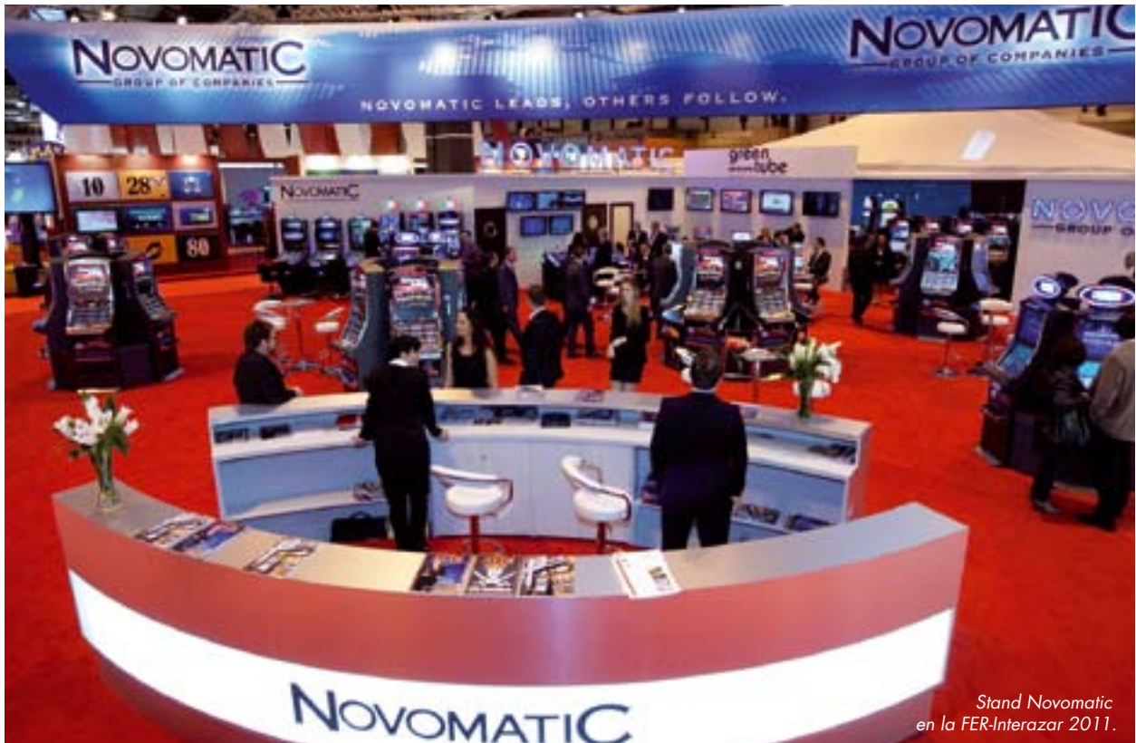
Stand Novomatic en la FER-Interazar 2011.