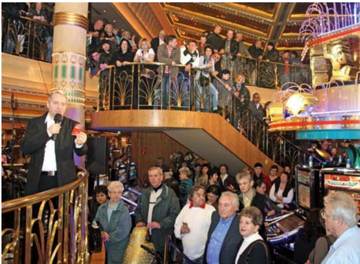
Casino Admiral Prater celebrando su sexto aniversario.