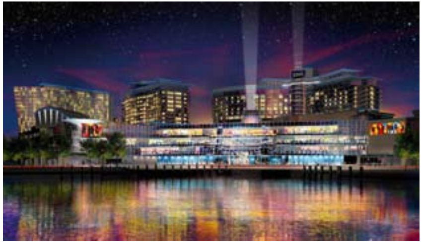
El complejo Star City de Sydney.