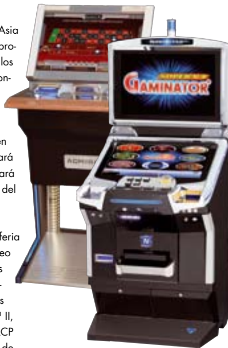
Novo-Bar™ y NOVOSTAR® SL2.

Además, las combinaciones multijuego Coolfire™ II se exhibirán en una serie de gabinetes NOVOSTAR® SL2 (slant top). Disponible en tres diferentes versiones modulares, este gabinete abastece a toda la gama de aplicaciones de juegos modernos: NOVOSTAR® SL1 con un monitor para las instalaciones de múltiples jugadores y NOVOSTAR® SL2 con dos monitores, así como NOVOSTAR® SL3. El atractivo estilo está acentuado con detalles iluminados con sistema LED que producen elegantes efectos brillantes y provocan