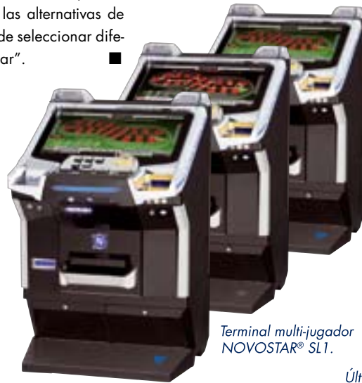
Terminal multi-jugador NOVOSTAR® SL1.