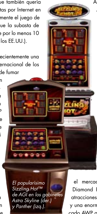
El popularísimo Sizzling Hot™ de AGI en los gabinetes Astra Skyline (der.) y Panther (izq.).

Los últimos desarrollos de productos de Astra para el mercado AWP holandés están basados en la plataforma de juego Coolfire™ II y combinan los últimos avances en gabinetes realizados por Astra con juegos internacionalmente probados de las vastas librerías de juegos de Astra y AGI. Recientes versiones de juegos y clásicos internacionales para el mercado holandés tales como Always Hot™, Diamond Bingo™ (un juego estilo Keno) y muchas atracciones más han establecido una posición excelente y una enorme popularidad con los clientes en este mercado AWP altamente competitivo.