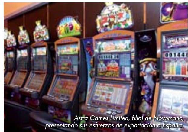
Astra Games Limited, filial de Novomatic, presentando sus esfuerzos de exportación a España.

La esperanza ahora es que Fer-Interazar consolide su posición como la feria para todo el mercado español y que la industria local responda positivamente invirtiendo de manera innovadora para así mejorar aún más el apetito indudable que existe por juegos de entretenimiento en esta vibrante y emocionante nación donde tanto los clientes locales como los turistas tienen igual importancia. ■