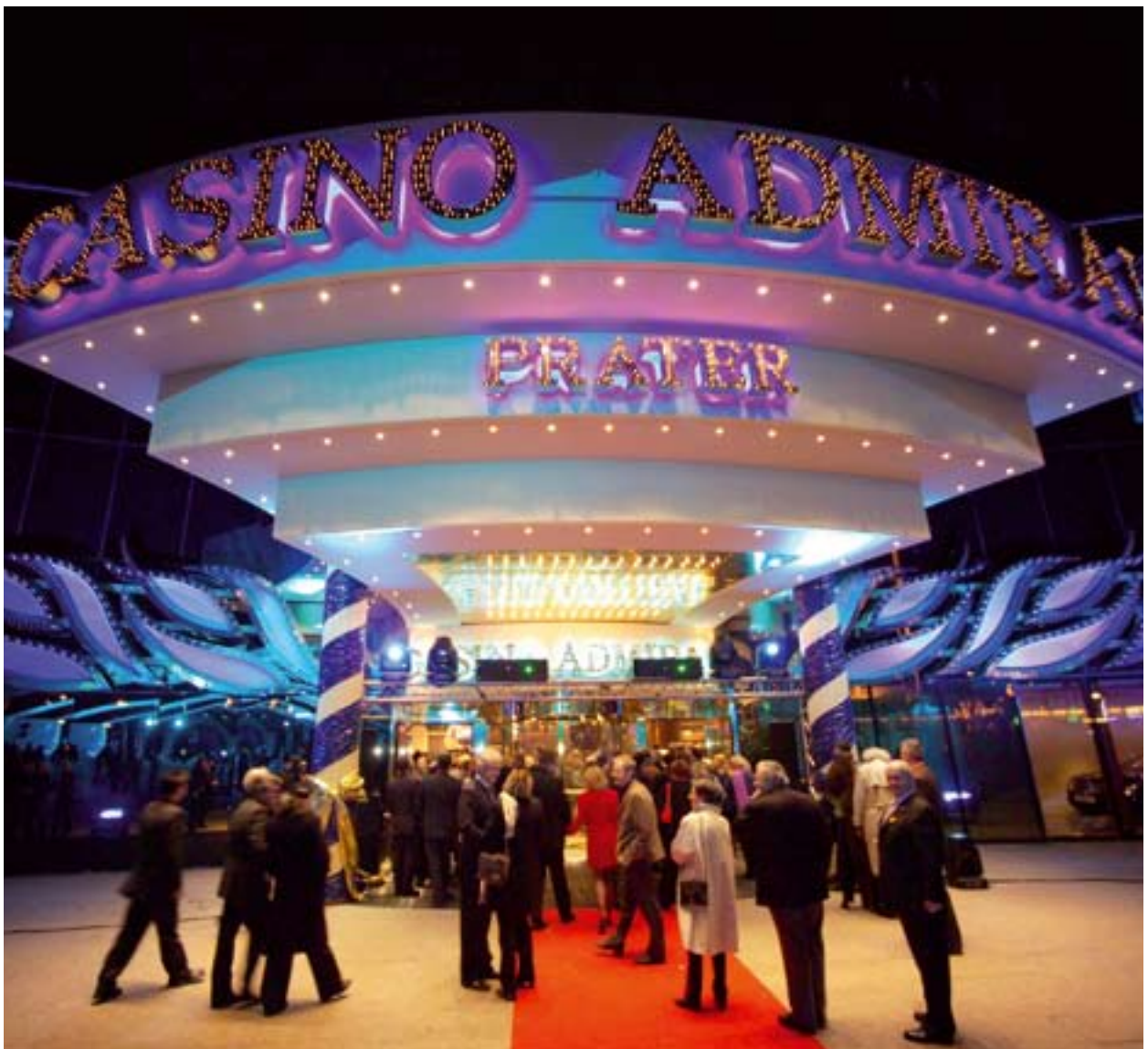
Casino Admiral Prater celebrando su sexto aniversario.