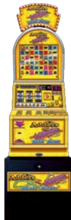
Tragamonedas Adders & Ladders de Empire Games.