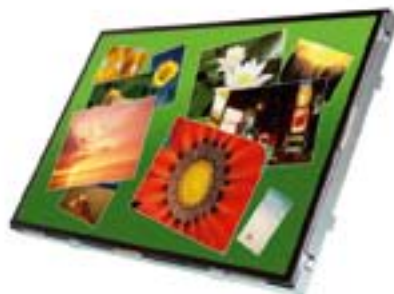
3M C2254PW Chassis