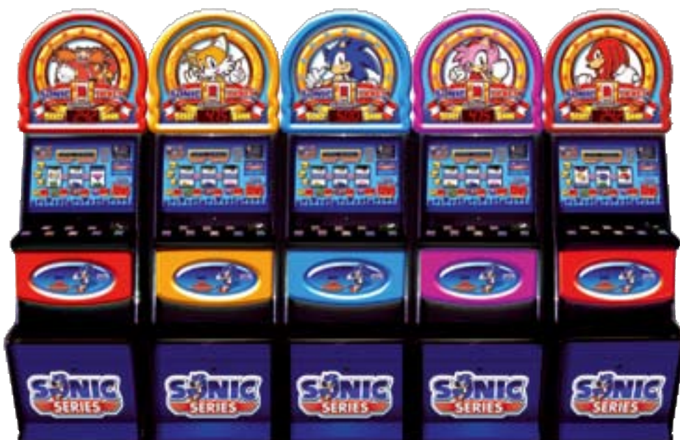
Nueva máquina video-tragamonedas con personajes ‘Sonic’ de Sega.