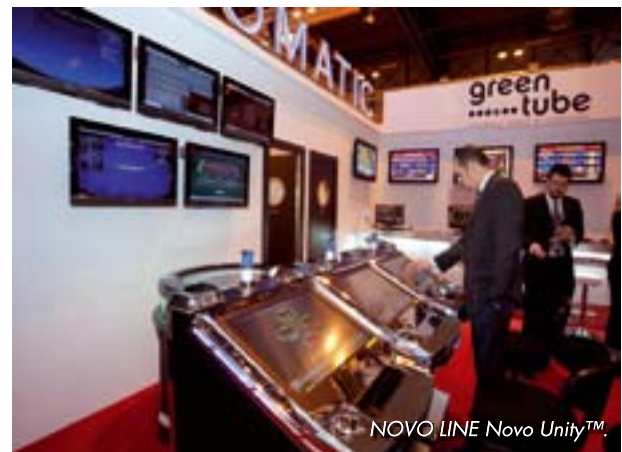
NOVO LINE Novo Unity™.