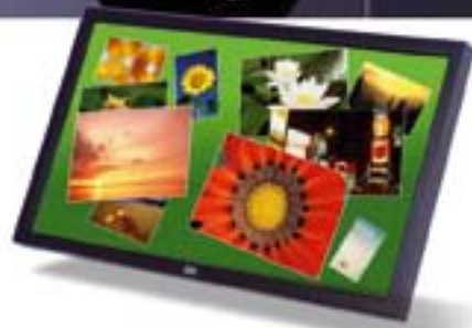
3M C3266PW Chassis