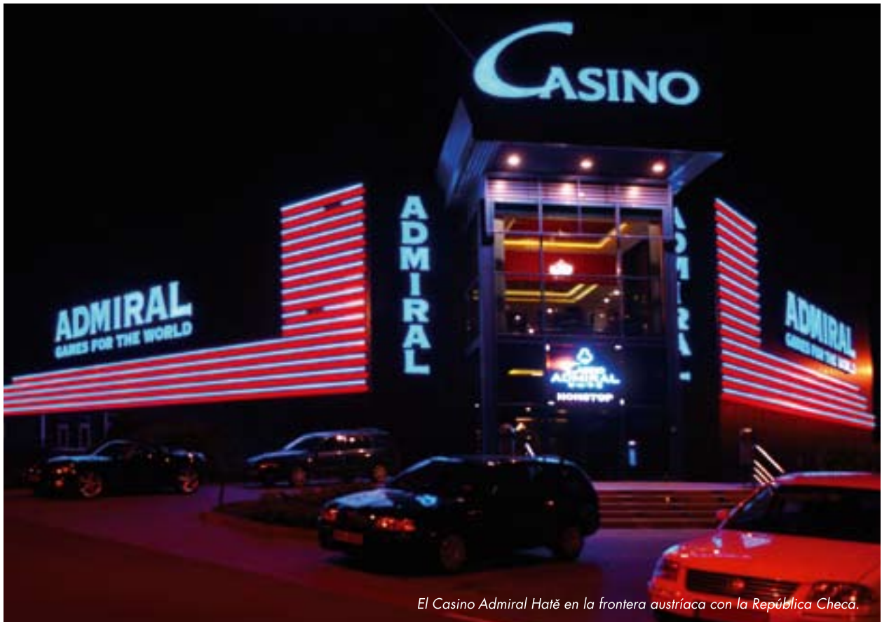
El Casino Admiral Hatě en la frontera austríaca con la República Checa.