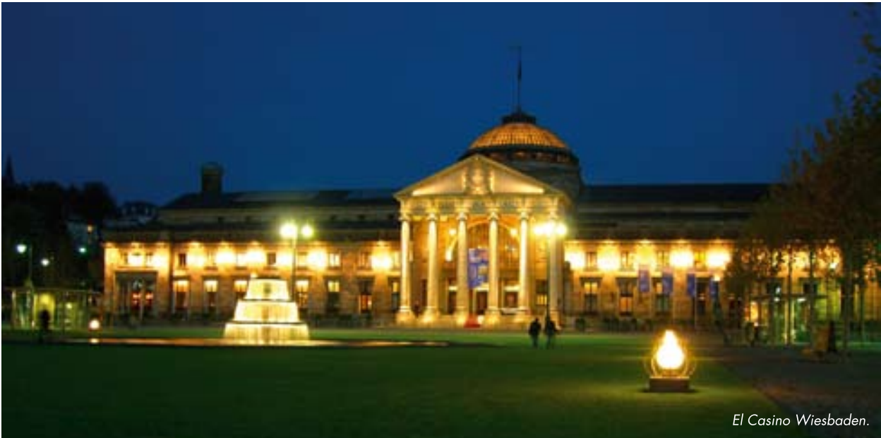
El Casino Wiesbaden.