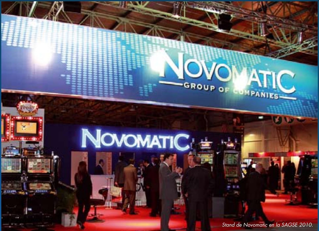
Stand de Novomatic en la SAGSE 2010.