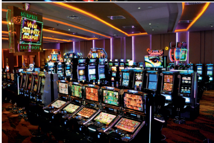
Máquinas de juego NOVOMATIC en el Casino Viva! de Chipre.