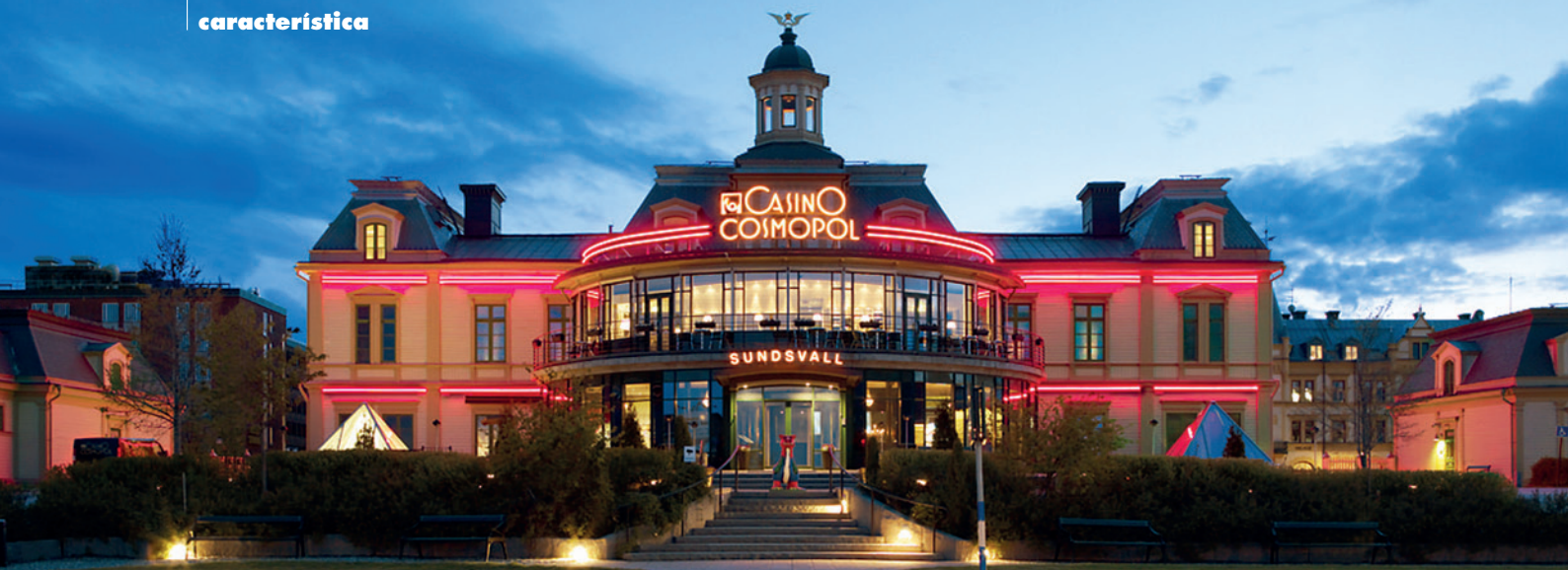
Casino Cosmopol Sundsvall.