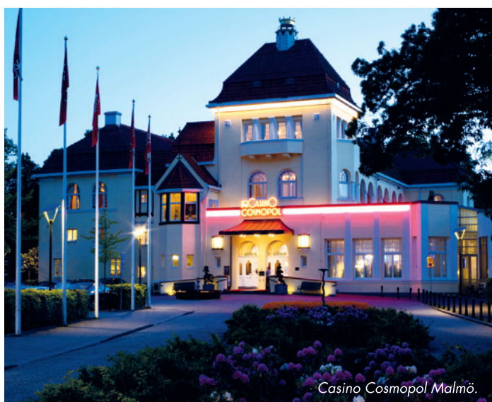
Casino Cosmopol Malmö.

El Casino Cosmopol posee un largo historial como cliente de NOVOMATIC. Los cuatro casinos operan una amplia variedad de gabinetes NOVOMATIC y equipamiento que comprenden una selección de video slots y combi-