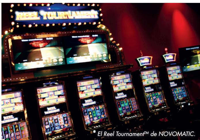
El Reel Tournament™ de NOVOMATIC.

Y agrega: "Debo admitir que estamos muy conformes con los productos, el servicio y el soporte de NOVOMATIC, desde el momento en que se decide adquirir un juego hasta su último día en nuestras salas".