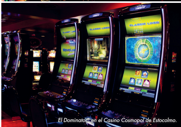
El Dominator® en el Casino Cosmopol de Estocolmo.