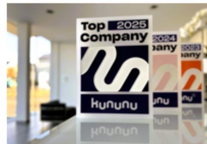
Löwen Entertainment ist zum vierten Jahr in Folge unter den am besten bewerteten Arbeitgebern.

Löwen Entertainment erhält das Top Company-Siegel 2025 der unabhängigen Arbeitgeber-Bewertungsplattform kununu. Damit sei das Unternehmen zum vierten Jahr in Folge unter den am besten bewerteten auf der Online-Plattform, berichtete das Binger Unternehmen. Nur fünf Prozent aller Arbeitgeberprofile würden sich für die Auszeichnung als beste Arbeitgeber in Deutschland qualifizieren. Basis dafür seien die kununu-Bewertungen von Arbeitnehmern innerhalb der letzten zwölf Monate.