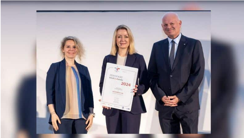
Novomatic wird Top-arbeitgeber 2025 mit mehrmaliger Auszeichnung. Vollzertifikat „berufundfamilie“ wurde unter anderem an das Unternehmen vergeben.

Der Gaming-Riese Novomatic mit Sitz in Österreich setzt gleich zu Beginn des Jahres ein starkes Zeichen für herausragende Arbeitsbedingungen und Recruiting-Prozesse. Das Unternehmen hat weltweit über 25.000 Mitarbeitende und hat sich als führender Gaming-Technologiekonzern etabliert. In diesem Zusammenhang konnte sich Novomatic mit seinen etlichen Tochtergesellschaften auch als erstklassiger Arbeitgeber auszeichnen. Jüngst wurde Novomatic als Top-Arbeitgeber 2025 mehrfach ausgezeichnet. Im Mittelpunkt der Auszeichnungen standen die Zukunftsfähigkeit, die Mitarbeiterzufriedenheit und das innovative Recruiting des Glücksspielkonzerns.