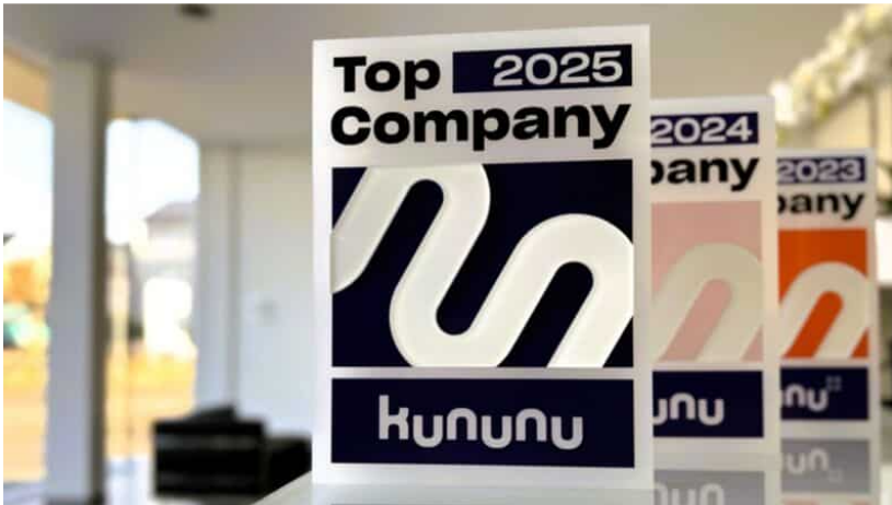
Löwen Entertainment bekommt zum vierten Mal in Folge das Top Company-Siegel. Damit zeichnet sich das Unternehmen als Top-Arbeitgeber aus.

Löwen Entertainment hat es auch 2025 geschafft! Zum vierten Mal in Folge wurde das Glücksspielunternehmen mit dem begehrten Top Company-Siegel ausgezeichnet. Die unabhängige Arbeitgeber-Bewertungsplattform kununu zeichnet jedes Jahr zahlreiche Unternehmen verschiedener Branchen aus und würdigt damit die Leistungen der Arbeitgeber. Dadurch das, dass Top Company-Siegel an Löwen Entertainment ging, beweist der Glücksspielanbieter erneut, dass er einer der besten Arbeitgeber in Deutschland ist. Insgesamt qualifizieren sich nur 5 Prozent aller Arbeitgeberprofile auf kununu für diese Auszeichnung.