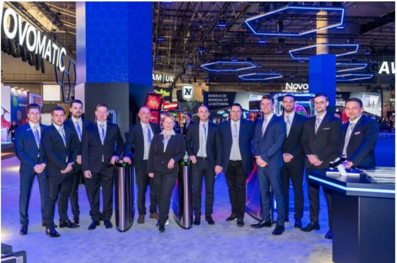
Das NOVOVISION Messteam.