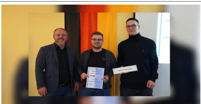
Ende des vergangenen Jahres erhielt Löwen Entertainment eine andere Auszeichnung. Als eines von vier Unternehmen im Landkreis Mainz-Bingen wurde Löwen Entertainment erneut als Ökoprofit-Betrieb ausgezeichnet.

Für Fachkräfte und Jobsuchende, die Wert auf ein positives Umfeld legen, kann der Glücksspielanbieter eine attraktive Wahl sein. Mit dieser Anerkennung bleibt Löwen Entertainment weiter auf Erfolgskurs.