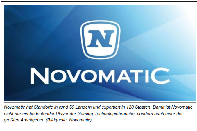
Novomatic hat Standorte in rund 50 Ländern und exportiert in 120 Staaten. Damit ist Novomatic nicht nur ein bedeutender Player der Gaming-Technologiebranche, sondern auch einer der größten Arbeitgeber.