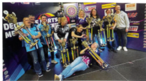
Frauenpower: Die emotionale Siegerzeremonie der Masters of Masters bei den Damen.

szeniert die größten Events im E-Darts, darüber hinaus verfügt er über den größten Ligaspielbetrieb weltweit – und dies im Darts schlechthin. Wohingegen es sich bei den Profis in der PDC (Professional Darts Corporation) insgesamt nur um wenige Akteure handelt, wobei sich immer alles um den Besten dreht – früher Phil Taylor, heute Luke Littler. In diesem Jahr werden bei der WM im Ally Pally in London erstmalig 128 Spieler statt 96 an den Start gehen.