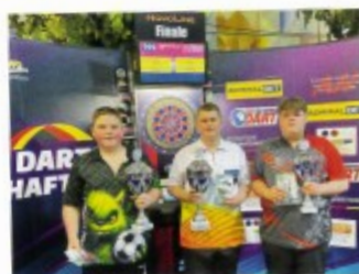
Begeisterter E-Dart-Nachwuchs: Die drei besten Youngsters.