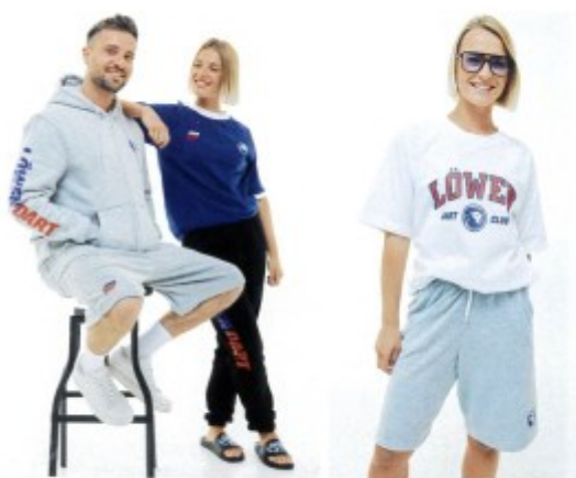
Die Löwen-Dart-Kollektion ist unter shop.novoline.de erhältlich. Sie verbindet die Marke mit Modetrends.

Löwen Entertainment präsentiert eine neue Freizeitkollektion – gebrandet mit der Marke Löwen Dart. „Inspiriert vom Retro-College-Look und der Emotionalität des Dartsports bietet sie Kleidung, die sowohl im Alltag als auch bei Dartturnieren beeindruckt“, wird betont. Das Angebot reicht von Löwen-Dart-Hoodies, Club-Shirts und Jogginghosen über Poloshirts und Shorts bis hin zu Caps und Badelatschen („Dartiletten“). Unisex-Mode in den Größen S bis 3XL.