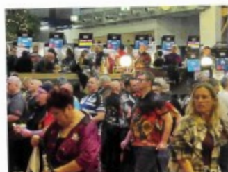
Teilnahmerecord bei der DM: Viel Trubel und effiziente Organisation.