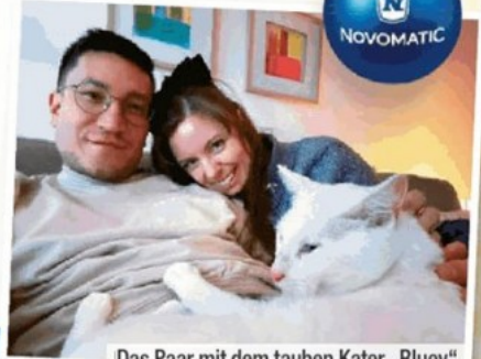
Das Paar mit dem tauben Kater „Bluey“

Das „Heute“-Christkind und Novomatic springen mit 500 Euro ein: „Wir haben auf ein Weihnachtswunder gehofft, jetzt ist es wirklich eingetreten!“